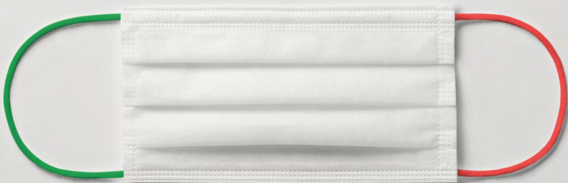
Azzurra by Noctis